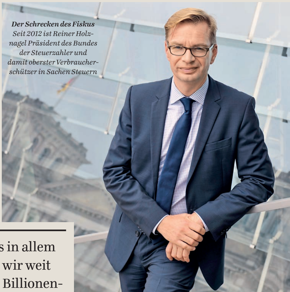
Der Schrecken des Fiskus Seit 2012 ist Reiner Holznagel Präsident des Bundes der Steuerzahler und damit oberster Verbraucherschützer in Sachen Steuern

Reiner Holznagel, Präsident des Bundes der Steuerzahler