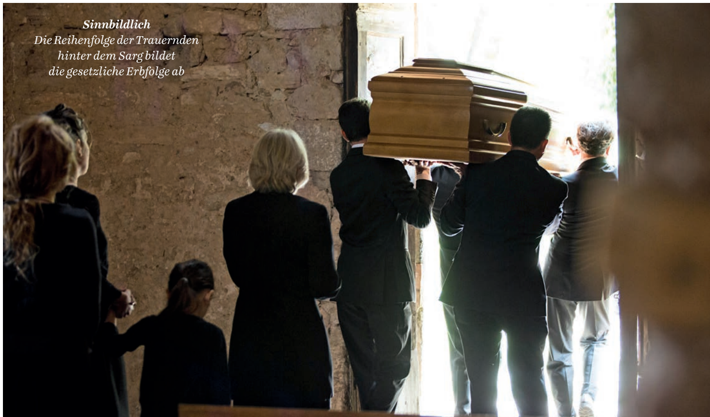
Sinnbildlich Die Reihenfolge der Trauernden hinter dem Sarg bildet die gesetzliche Erbfolge ab

Wer einigermaßen harmonisch das bürgerliche Familienmodell lebt, muss seinen Nachlass nicht zwingend regeln. Das Gesetz sorgt dafür, dass die nächsten Angehörigen erben